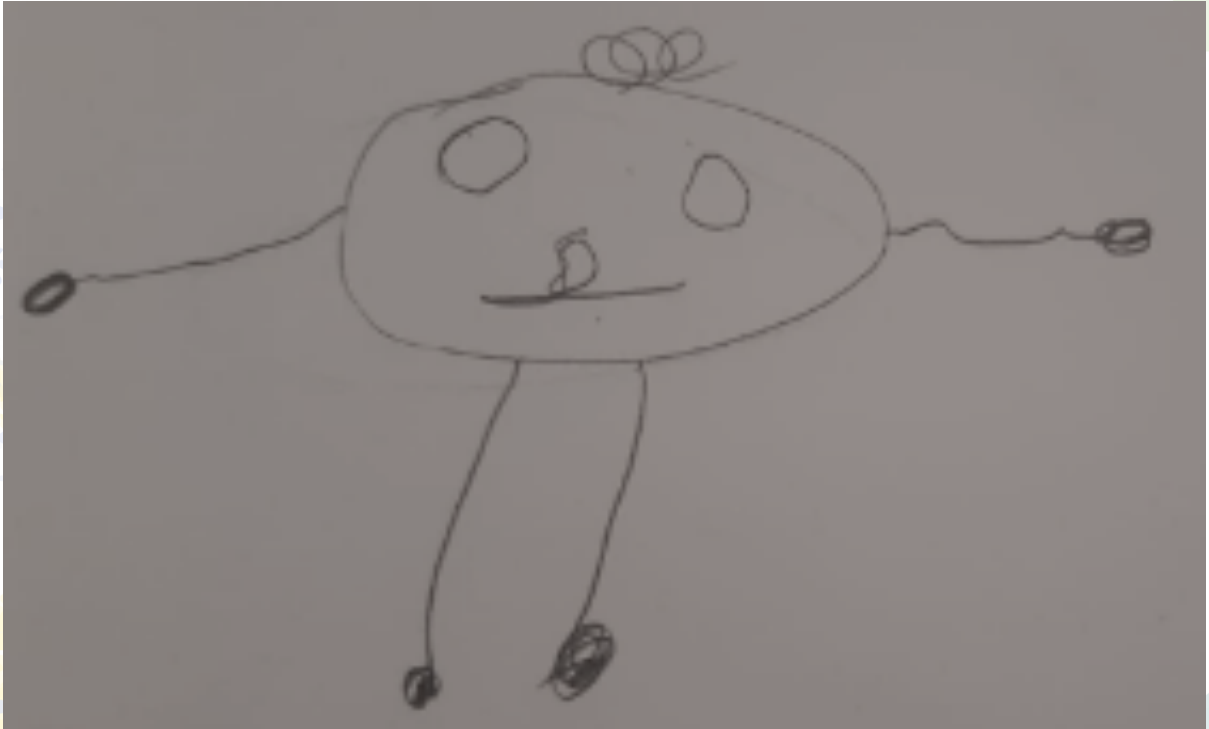
Resim 4: İnsan Figürü

6 yaş itibarıyla gerçekçi resimler oluşur, figürler sayfada bir araya gelmeye başlar. Annesinin karnındaki kardeşini çizen çocuk bizlere saklı gerçekleri gösteriyor olabilir. Tüm bunlar dikkatlice değerlendirilmelidir. 5-7 yaş çocukların resimlerinde saydamlık özelliđi görünür. Çocuk bu resimlerde, bir objenin içinde veya arkasında olan, bakıldığında görünmesi mümkün olmayan eşyaları görüyormuş gibi çizebilir. Örneđin bir ev ve evin içinde insanları, eşyaları çizer (Yavuzer, 1993). Bir apartman resmi yapan çocuk, kendi evinin içini dışarıdan görülecek şekilde çizebilir veya arabanın içindeki, kapının arkasındaki vücutları da çizebilir.