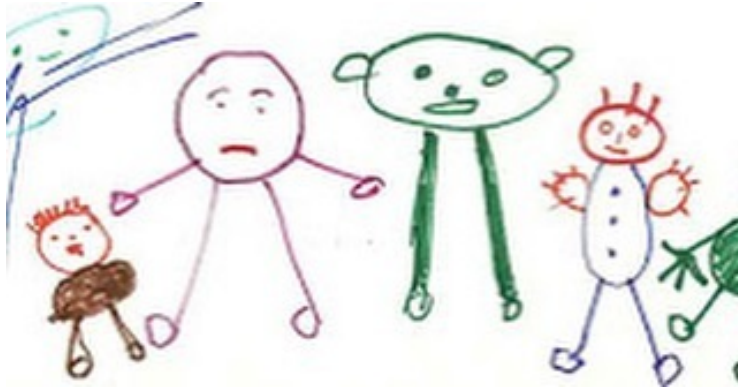
Resim 3: Şema Öncesi Dönem Resim Örneđi

Şema öncesi evrede görüşler büyük oranda öznelidir. Buradaki çizimler genellikle duygu ve hayallerin yansımasıdır. Çizimlerdeki vücut oranları ölçsüzdür. Çocuklar perspektif endişesi yaşamadan, sevdikleri renklerle resim yaparlar. Bu evrede insan, eşya ve hayvan figürlerinin tanımı gerçeđe oldukça yakın olup bunlara hareket verebilirler.