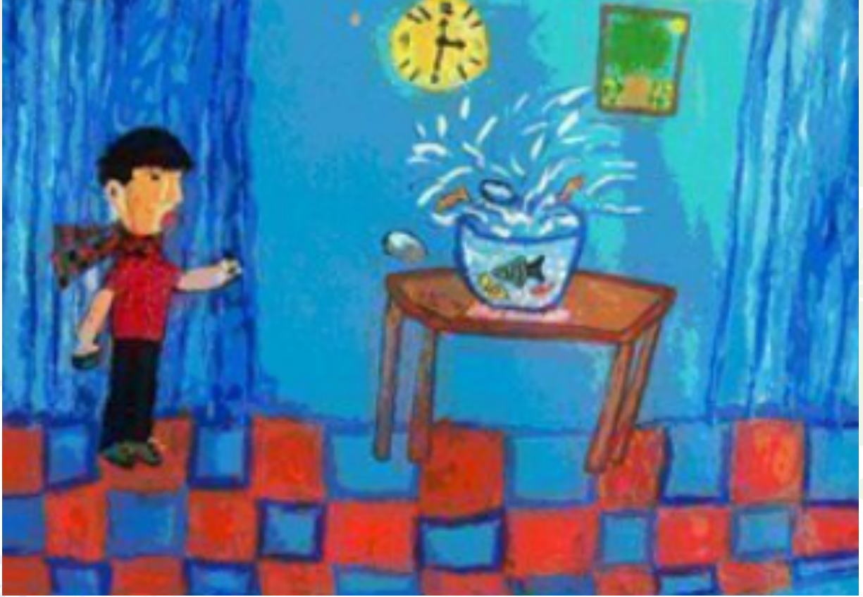
Resim 6: Gerçekçilik Döneminde Çizilen Örnek Bir Resim

Bu yaşlardaki çocuk toplumun bir üyesi olduğundan haberdardır, çocuk bedensel ve psikolojik gelişim açısından kritik bir dönemdedir. Dönemin en önemli özelliđi realizmin gözle görülür şekilde artmasıdır.