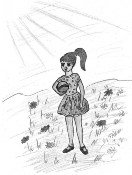
Resim 1: İnsan Resmi

Öz güven ve güvenlik duygusu hâkimdir, resimdeki figürler havada asılıymış gibi değildir. Figürler zeminle temastadırlar ve sayfanın merkezindedirler. Sayfanın sağ tarafına veya sol tarafına yapışık değildir. Kenar çizgiler (konturlar) net ve belirgindir. Figürlerde çoğunlukla bir hareket yansıtılmıştır. Kollar ve bacaklar rahat gibi görünürler (Bkz. Resim 1: İnsan Resmi).