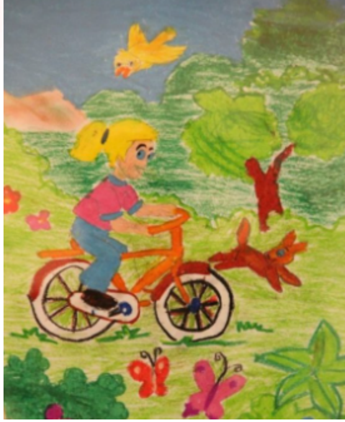
Resim 7: Görünürde Doğalcılık Döneminde Çizilen Bir Resim Örneđi

Bu dönem ergenlikle örtüşmektedir, dolayısıyla cinsel öğelerin resimlerde büyük ölçüde belirginleştiđi söylenebilir. Oranlarda boyut kadar derinlik de sağlıklı bir şekilde verilmeye başlanır. Renkleri doğru şekilde kullanma söz konusudur. Nesnelere orantılı ve perspektiflidir. Zihinsel gelişimde aksaklıklar olduğunda veya ruhsal problemler söz konusu olduğunda çizilen resimlerin de yaş dönemlerine uygun olmadıkları gözlenmektedir.