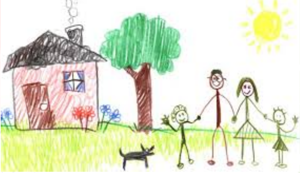
Resim 5: Şematik Dönemde Çizilen Örnek Bir Resim