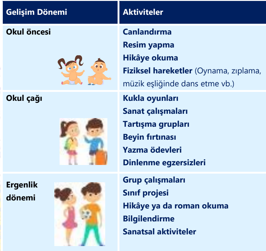
Tablo 2. Gelişim Dönemlerine Göre Afetten Etkilenen Çocuklara Yönelik Aktiviteler

Netice itibarıyla çocukların afetle birlikte ortaya çıkan yeni duruma uyum sağlayabilmeleri, güven duygusunu hissedebilmeleri, ilgi görebilmeleri, dayanışma ruhunu yaşamaları, baş etme mekanizmaları geliştirmeleri gibi pek çok hususta oyunların ve eğlenceli etkinliklerin katkısı bulunmaktadır. Ancak çocuklarla yürütülecek tüm rekreasyonel aktivitelerde mutlaka çocukla iletişim ve etkileşim konularında bilgi ve beceriye sahip profesyonellerin ve gönüllülerin sürece dahil olmasını sağlamak gerekir.