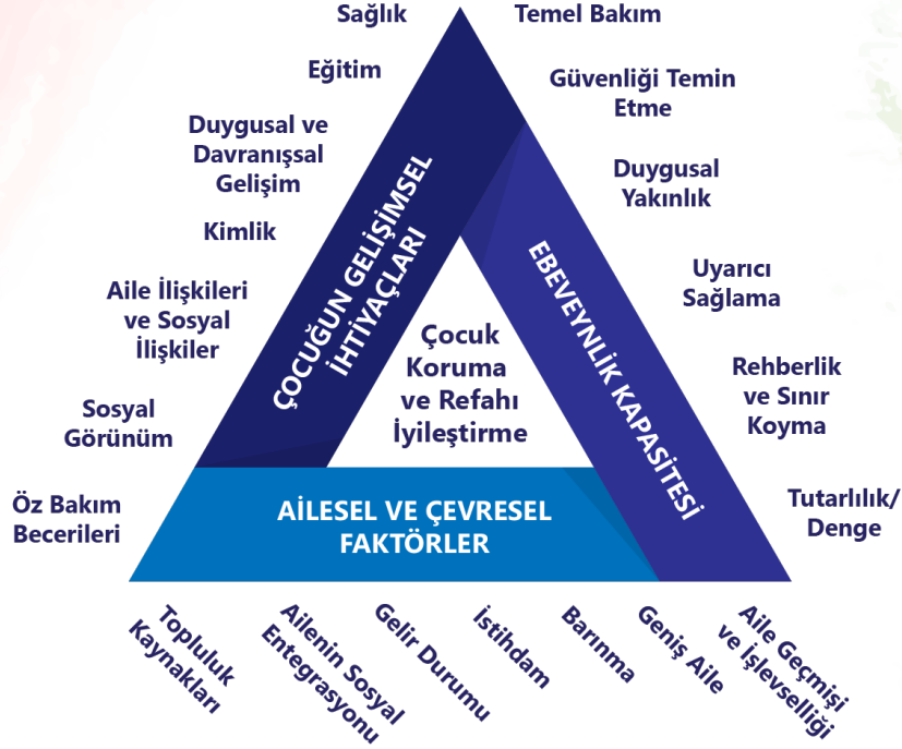
Şekil 1: Ortak Değerlendirme Çerçevesi